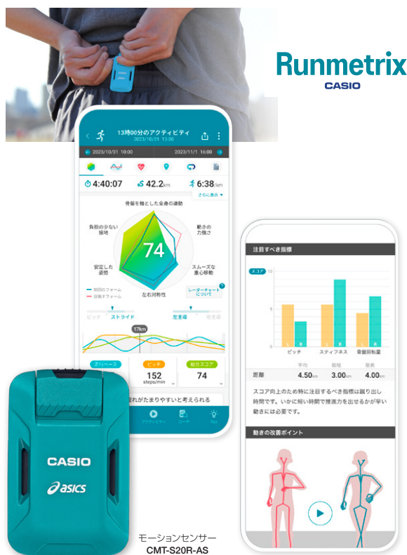
モーションセンサー CMT-S20R-AS