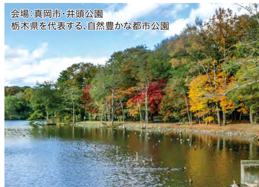
会場:真岡市・井頭公園 栃木県を代表する、自然豊かな都市公園