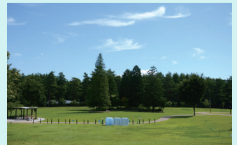
メイン会場はアルプス広場