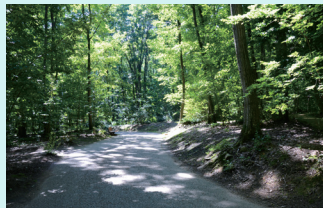
コースの半分は木陰