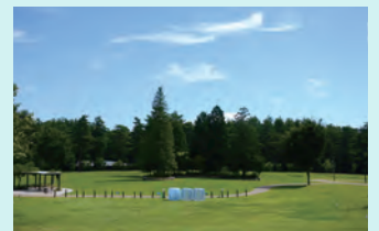
メイン会場はアルプス広場