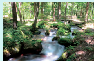
溪流のせせらぎを聞きながら走れる!