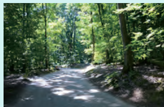
コースのほとんどは日陰