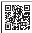
大会ホームページ

URL https://runners.30k-series.com/tokyo-autumn-30k/